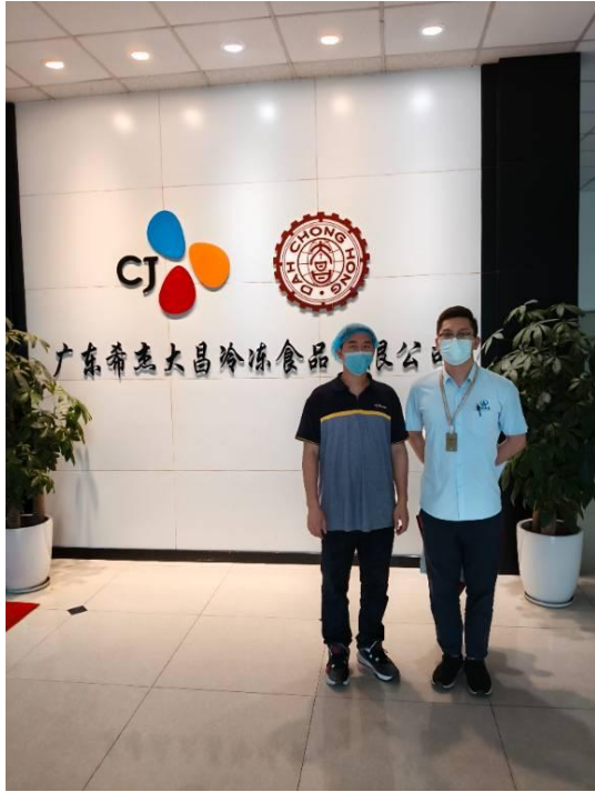
(证明现场调查、现场采样、现场检测的图像影像)